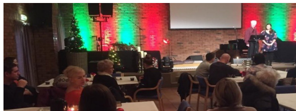
Fra familiemøtet i desember