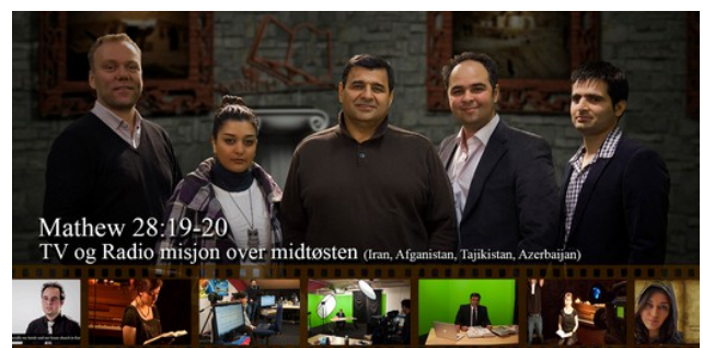
Mathew 28:19-20 TV og Radio misjon over midtøsten (Iran, Afghanistan, Tadjikistan, Azerbaijan)

Vi takker Gud for at han har gitt oss denne muligheten til å være misjonærer på en moderne måte, via TV, radio og Internett.